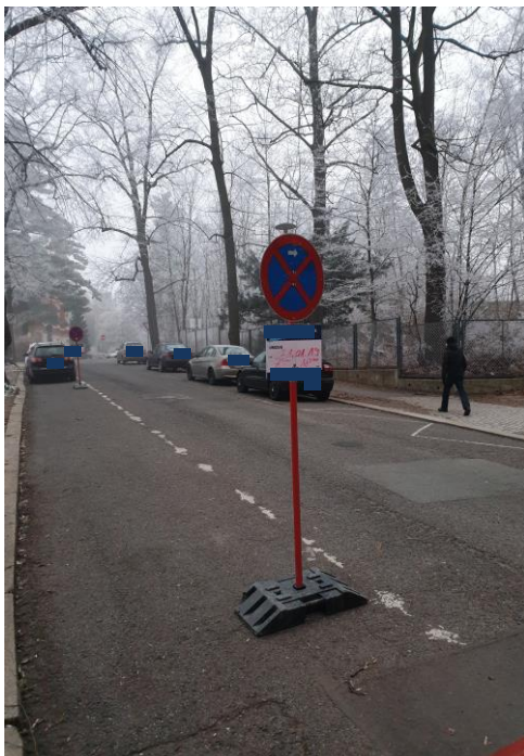
(Stand 21.01.2019)